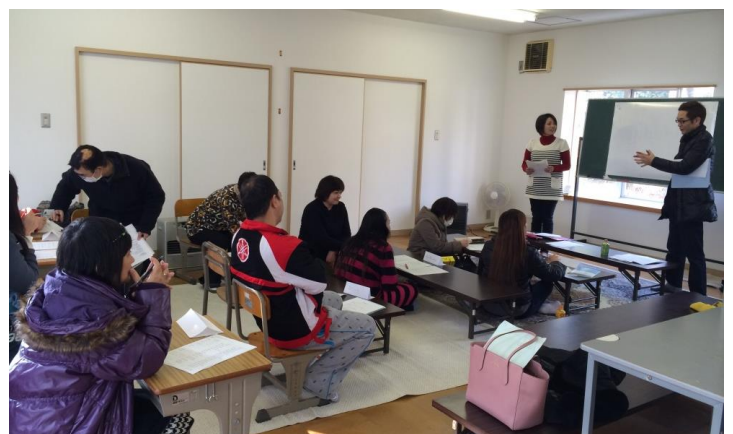
県営浜北団地にて (2015.2.8)

参加した方々は熱心に聞いてくれて、積極的に質問をしてくれました。皆さんの熱意のおかげで充実した勉強会になりました。