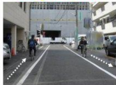
※路側帯を通行する場合は、歩行者の通行を妨げないよう走行しましょう。