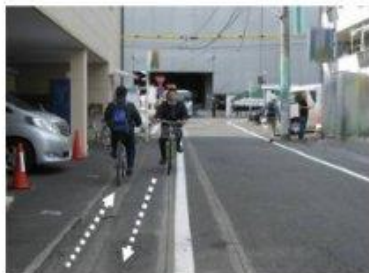
※道路の左側及び右側にある路側帯どちらも通行可能ですが・・・